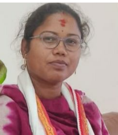
రాజకీయాలను ప్రజలు క్షేమించారు అన్నారు

ములుగు జిల్లా (ప్రతినిధి) వార్త పత్రిక : తెలంగాణ రాష్ట్రం మనకు విలువలు వారసత్వంగా ఇచ్చిన సమాజం సంస్కారం మన కుటుంబం వారసత్వ ఆస్తి అలాంటి సమాజంలో మహిళను గౌరవించే పద్ధతి మనకు అనవాయితీ రాజకీయాల కోసం ఆధారాలు లేకుండా మహిళలను విమర్శన చేయడం సరియేంది కాదు మనం ప్రజాస్వామ్య దేశంలో ఉన్నాం ప్రతి అంశం ప్రజలు గమనిస్తున్నారని రాజకీయ నాయకులు సమన్వయంతో ఆలోచనతో విచక్షణ కోల్పోకూడదు అని ప్రజలు కోరుకుంటున్నారని ఆధారాలు లేకుండా విమర్శనలు చేయడం ప్రజలు గమనిస్తున్నారని బి.ఆర్.ఎస్ నాయకులు అభివృద్ధి కాంగ్రెస్ పార్టీ అసెంబ్లీ వేదికగా కీర్తించిన విషయం మరిచారా? పది ఏళ్ళు పాలన చేసి తెలంగాణ రాష్ట్రంలో రాజ్యాంగా సంస్థలను కులదోకారు ప్రజల హక్కులను నీరుగరచారు మీ పాలనలో ఏమి గు చెందిన ప్రజలు కాంగ్రెస్ కి పట్టం కట్టారు ఇప్పుడు ఇప్పుడే రాష్ట్రంలో అభివృద్ధి జరుగుతుంది తెలంగాణ అన్ని వర్గాల ప్రజల సమస్యలు తన కుటుంబ సమస్యలుగా భావించి మంత్రి సీతక్క ఒకటి ఒకటిగా పరిష్కారం చేస్తున్నారని బి.ఆర్.ఎస్ నాయకులు ప్రజల అభివృద్ధి పై విచక్షణ ద్ది ఉంటే ప్రజా పాలనకు సహకరించాలి తప్ప ఇలాంటివి