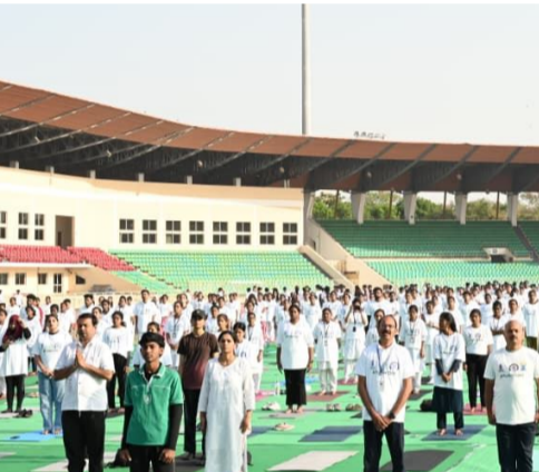
యోగా కీలక పాత్ర పోషిస్తుందని అన్నారు జిల్లాలో యోగా పట్ల ఆధికారులు సిబ్బంది విద్యార్థులు.