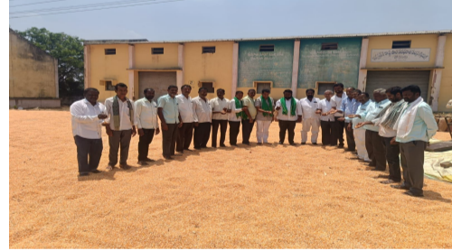
తమతో మొక్కజొన్నలను కేంద్రాలకు తీసుకువచ్చి వారం రోజుల్లో డబ్బులు పొందాలని కోరారు. కేంద్రానికి మొక్కజొన్నలు తీసుకువచ్చే రైతులు వంట సాగు ధ్రువీకరణ పత్రం, పట్టాదారు పాస్ పుస్తకం జిఎస్ టి, ఆధార్ కార్డు జిఎస్ టి లు వెంట