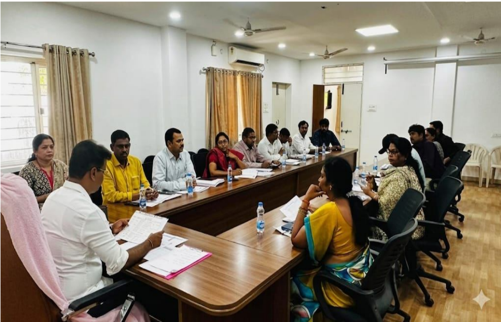
ప్రాంతంలో భూగర్భ కాలువల సామర్థ్యాన్ని పెంచేందుకు ప్రణాళికలు రూపొందించాలని సూచించారు. సమగ్ర ప్రణాళికతో అభివృద్ధి పనులు చేపట్టి కుత్బుల్లాపూర్ నియోజకవర్గాన్ని ఆదర్శప్రాయంగా తీర్చిదిద్దాలని అధికారులను ఆదేశించారు. ఈ సమావేశంలో ఉన్నతాధికారులు, ఇంజనీరింగ్ సిబ్బంది పాల్గొన్నారు.

వార్తపత్రిక, కుత్బుల్లాపూర్, ఏప్రిల్ 9: కుత్బుల్లాపూర్ నియోజకవర్గంలో మౌలిక వసతులను మరింత మెరుగుపరచి ఆదర్శవంతమైన ప్రాంతంగా తీర్చిదిద్దాలని ఎమ్మెల్యే కేపీ వివేకానంద్ పేర్కొన్నారు. ఇప్పటికే మంజూరైన పనులను త్వరితగతిన పూర్తి చేసి, కొత్త ప్రతిపాదనలను కూడా ప్రజలకు అందజేయాలి అని ఆధికారులను ఆదేశించారు. పేజీ బడ్జెట్లోని ఎమ్మెల్యే కార్యాలయంలో గురువారం నిర్వహించిన సమావేశంలో నియోజకవర్గంలోని పలు పరిధులకు చెందిన మహానగర పాలక సంస్థ ఇంజనీరింగ్ విభాగ అధికారులతో ఎమ్మెల్యే కేపీ వివేకానంద్ అభివృద్ధి పనులపై సమీక్ష నిర్వహించారు. ఈ సందర్భంగా ఆయన మాట్లాడుతూ, అభివృద్ధి కార్యక్రమంలో భాగంగా మంజూరైన రూ. 32 కోట్ల విలువగల పనులను నిర్దిష్ట కాలపరిమితిలో పూర్తి చేయాలని సూచించారు. కొత్తగా ప్రతిపాదించిన రూ. 72 కోట్ల పనులను త్వరగా ప్రారంభించి ప్రజలకు అందుబాటులోకి తీసుకురావాలని తెలిపారు. బస్టాప్, కాలనీలలో జరుగుతున్న అభివృద్ధి పనులను వేగవంతంగా పూర్తి చేసి ప్రజలకు ఎటువంటి అసౌకర్యం కలగకుండా చూడాలని అధికారులకు సూచించారు. సిమెంట్ రహదారులు, రహదారి మరమ్మత్తులు, భూగర్భ కాలువలు, పారుదల అభివృద్ధి, వీధి దీపాలు ఏర్పాటు చేయాలని ప్రాధాన్యతగా చేపట్టాలని ఆహ్వానించారు. పట్టణకరణ, జనాభా పెరుగుదల దృష్ట్యా అవసరమైన