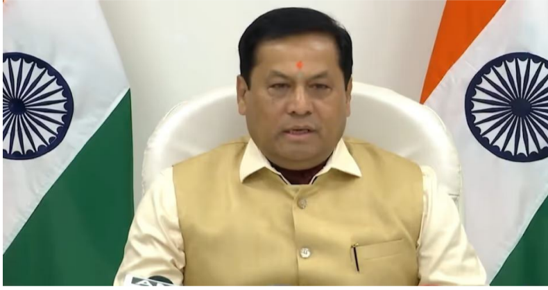
చేసిన అభివృద్ధి పనులే తమను గెలిపిస్తాయని సోనోవాల్ అన్నారు. అస్సాంను అభివృద్ధి పథంలో నడిపించడానికి అవసరమైన మౌలిక ప్రమాణాలను కోరుకుంటున్నారని, మోదీ

దెబ్రాగఢ్, ఏప్రిల్ 9: అస్సాం అసెంబ్లీ ఎన్నికల పోలింగ్ ఈ రోజు (ఏప్రిల్ 9) జోరుగా సాగుతోంది. కేంద్ర ఓడరేవులు, నౌకాయన శాఖ మంత్రి సర్దానంద సోనోవాల్ తన స్వగ్రామమైన డెబ్రాగఢ్లో ఓటు హక్కును వినియోగించుకున్నారు. అనంతరం ఆయన మీడియాతో మాట్లాడుతూ, రాష్ట్రంలో బీజేపీ నేతృత్వంలోని ఎన్డీయే (బీజేపీ) కూటమి భారీ విజయాన్ని సాధించే చోటులో ఉందని ధీమా వ్యక్తం చేశారు. ఈ ఎన్నికల్లో ఎన్డీయే కూటమి సుమారు 100 సీట్లను కైవసం చేసుకుంటుందని సోనోవాల్ చెప్పారు. 'ఎన్నికల ప్రచారం ప్రారంభమైన మొదటి రోజు నుంచి నేను ఇదే చెబుతున్నాను. ప్రజల నుంచి వస్తున్న స్పందన మాన్యుల్ మా కూటమి వంద సీట్లకు పైగా గెలవడం ఖాయం' అని ఆయన పేర్కొన్నారు. గత పతేజ్లో ప్రధాని నరేంద్ర మోదీ నేతృత్వంలోని డబుల్ ఇంజన్ ప్రభుత్వం