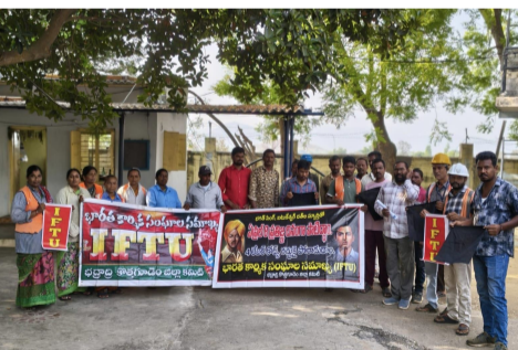
వార్తపత్రిక:బీకులపల్లి,ఏప్రిల్ 9 :కేంద్ర ప్రభుత్వం