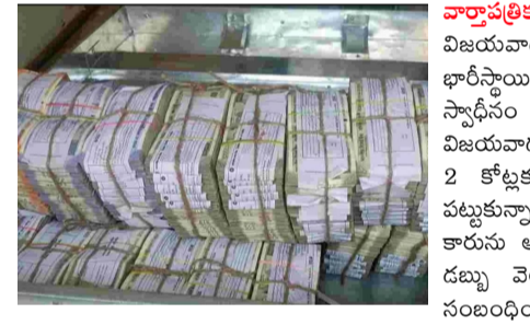
తీసుకున్నారు. నగదును శాఖాధికారులకు అప్పగించారు.

వాడ ప్రతిక ప్రతినిధి అసంతోషం : ఎపి: విజయవాడలోని గుణదల ప్రాంతంలో భారీస్థాయిలో హవాలా నగదును పోలీసులు స్వాధీనం చేసుకున్నారు. ఒడిశా నుంచి విజయవాడకు అక్రమంగా తరలిస్తున్న రూ. 2 కోట్లకు పైగా నగదును తనిఖీల్లో పట్టుకున్నారు. అసమానాధంగా వెళ్తున్న కారును ఆపి సోదా చేయగా ఈ అక్రమ డబ్బు వెలుగుచూసింది. ఈ ఘటనకు సంబంధించి ఐదుగురిని అదుపులోకి