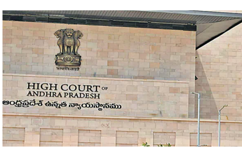
ఫ్యామిలీ కోర్టు జారీ చేసిన ఉత్తర్వులను అనుసరించి బిడ్డను తనకు అప్పగించాలని, ఆ అనుమతించాలని కోరారు. ఈ సందర్భంగా యూకే కోర్టు ఇచ్చిన ఉత్తర్వులను పరిశీలించిన

అమరావతి, ఏప్రిల్ 8: భారతదేశ న్యాయస్థానాలపై విదేశీ కోర్టులచే ఉత్తర్వులు ప్రభావితం చేయవని హైకోర్టు స్పష్టం చేసింది. విద్యుత్ సరఫరా విషయంలో తల్లిదండ్రుల బాధ్యత వ్యవహారంపై భారతీయ కోర్టులు విచారణాధికార పరిధిని వినియోగించకుండా దూరంగా ఉంటాయని, యూకే కోర్టు చేసిన వ్యాఖ్యలపై హైకోర్టు తీవ్ర అభ్యంతరం వ్యక్తం చేసింది. ఇలాంటి వ్యాఖ్యలు వలసవడ మనస్వత్వాన్ని ప్రతిబింబిస్తాయని ఆక్షేపించింది. భారత న్యాయవ్యవస్థపై ఇలాంటి సంచలిత ధోరణి, వలసవడ ఆనవాళ్లు పునరుద్ధరించదానికి అనుమతించబోమని స్పష్టం చేసింది.వలు అంశాలపై అభ్యంతరం: అత్యుపాధి, భార్య తన కుమార్తెను స్థిరపడిన గుంటూరు జిల్లాకు చెందిన ఓ సాఫ్ట్వేర్ ఇంజనీర్ గతేడాది హైకోర్టులో హెబియస్ కార్పస్ పిటిషన్ వేశారు. యూకే