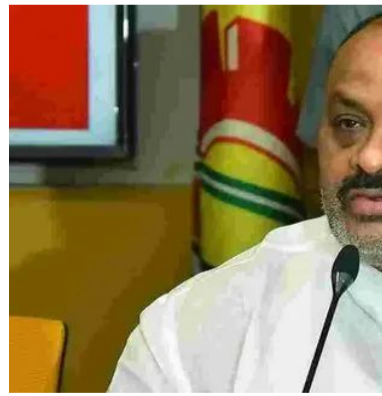
పశుమగ్గింపం జిల్లా, ఏప్రిల్ 8 : వైసీపీ ఆధిపత్య వైపున జగన్ మోహన్ రెడ్డి హయాంలో వ్యవసాయానికి తీరని నష్టం జరిగిందని ఏపీ వ్యవసాయ శాఖ మంత్రి కింకారావు అచ్చెన్నాయుడు ( తీవ్ర ఆగ్రహం వ్యక్తం చేశారు. వైసీపీ హయాంలోని ఐదేళ్లలో గోదావరి జిల్లాలో కాలువలో కనీసం మట్టి కూడా ఎందుకు తీయలేదని ప్రశ్నించారు. (బుధవారం) పశుమగ్గింపం జిల్లాలో అచ్చెన్నాయుడు పర్యటించి, పలు కార్యక్రమాలలో పాల్గొన్నారు. ఈ సందర్భంగా ఆయన మీడియాతో మాట్లాడారు.వైసీపీ హయాంలో అచ్చెన్నాయుడు చేసేదేమీ లేక క్రాస్ హరిజీ ప్రకటించారని