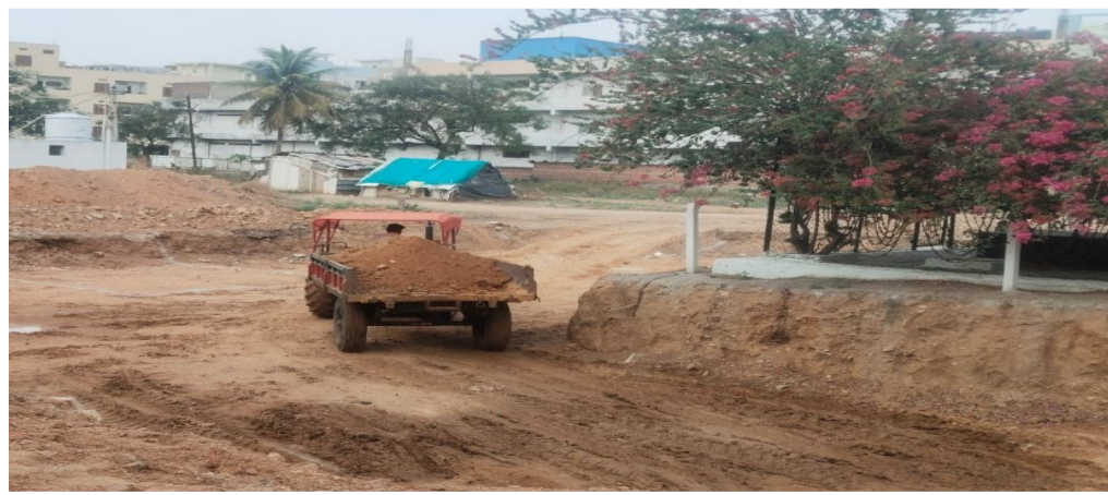
చర్యలు చేపట్టడం లేదో తెలపాలన్నారు. గత కొంతకాలంగా అధికారులు స్పందించకపోవడంతో పెద్ద ఎత్తున నిర్మాణాలు చేపడుతున్నారని, పేదవాడు చిన్న ఇల్లు కట్టుకుంటే నిబంధనలంటూ గద్దెల్లా వారి పోయే అధికారులు శంషాబాద్ లో జరుగుతున్న అక్రమ నిర్మాణాల విషయంలో అక్రమ సెల్లార్ల తవ్వకాల విషయంలో ఎందుకు మౌనం వహిస్తున్నారో అర్థం కాని విషయం గా మారిందనే ఆరోపణలు వినిపిస్తున్నాయి. ఇప్పటికైనా అధికారులు దృష్టి సారించి నిబంధనలు ఉల్లంఘించి జీవో 111 నిబంధనల తుంగలో తొక్కి అక్రమ నిర్మాణాలు చేపడుతున్న వారిపై అధికారులు చట్టబాహిర్య చర్యలు తీసుకోవాలని కోరుతున్నారు.

చార్జ్ పత్రక, రాజేంద్రనగర్, ఏప్రిల్ 08 : మధురానగర్ ఆర్బీసీగర్ తదితర ప్రాంతాల్లో అనుమతులు లేకపోయినా విచ్చలవిడిగా సెల్లార్లు తోడు అక్రమ నిర్మాణాలకు తెర లేపుతున్నారని స్థానికులు ఆగ్రహం వ్యక్తం చేస్తున్నారు. రంగారెడ్డి జిల్లా రాజేంద్రనగర్ నియోజకవర్గం శంషాబాద్ పురపాలక పరిధిలో జీవో 111 నిబంధనలు అమలులో ఉన్నప్పటికీ, నిబంధనలు ఉల్లంఘించి సెల్లార్ల పనులు చేపడుతున్న అధికారులు మాత్రం స్పందన లేకపోవడం దారుణమని స్థానికులు మండిపడుతున్నారు. శంషాబాద్ పురపాలక పరిధిలో ఆర్బీసీగర్ మధురానగర్ లో హిస్టారికంగా నిబంధనలు ఉల్లంఘించి పెద్ద ఎత్తున అక్రమ నిర్మాణాలు, అక్రమ సెల్లార్ల పనులు చేపడుతున్నారని ఈ విషయంలో అధికారులు ఎందుకు