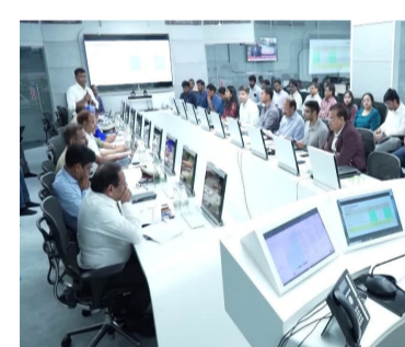
ఇబ్బందులు రాకుండా ముందే జాగ్రత్తలు తీసుకోవాలని దిశానిర్దేశం చేశారు. ఇసుక రీవల్ వద్ద, స్టాక్ యార్డుల వద్ద ఎక్కువ ఛార్జీలు వసూలు చేయడానికి వీల్లేకుండా గట్టి నిఘా పెట్టాలని ఆదేశించారు. ప్రభుత్వ పథకాలను ప్రజలకు చేరువ చేయడంలో పాటు సంకల్పిత కలిగించే రీతిలో సేవలు అందించినట్లుగా మంచి ఫలితాలు వస్తాయన్నారు.కాలేజీ విద్యను మరింత పటిష్టంగా తీర్చిదిద్దాలి: కాలేజీ విద్యను

అమరావతి, ఏప్రిల్ 8: సామాహిక గృహ ప్రవేశాల కార్యక్రమం ఈ ఏడాదిలో మరోసారి చేపట్టాలని సీఎం చంద్ర బాబు నిర్ణయించారు. టిడీపీ ఇళ్ల కాకుండానే మరో 5 లక్షల ఇళ్లను లబ్ధిదారులకు అందించాలని ఆదేశించారు. ప్రభుత్వం ప్రతిష్టా తృప్తిగా తీసుకున్న పథకాలు, కార్యక్రమాలను పక్కా ప్రణాళికలతో అమలు చేయాలని ఆర్టిజిఎస్ సమీక్షలో సీఎం స్పష్టం చేశారు. నిర్దేశించుకున్న లక్ష్యాలను చేరుకునే విషయంలో ఎలాంటి జాప్యం జరగకూడదన్నారు. సచివాలయంలోని ఆర్టిజిఎస్ కేంద్రం నుంచి వివిధ శాఖల పనితీరుపై సీఎం చంద్రబాబు సమీక్షించారు. ఇళ్ల నిర్మాణాన్ని పూర్తి చేసే విషయంలో అలసత్వం ఉండకూడదన్నారు. ఇంటి స్థలాలు పనికింటే ప్రక్రియను వేగవంతం చేయాలి (బుధవారం) సూచించారు. దాదాపు 2 లక్షల మంది ఇళ్ల స్థలాలు కోరినట్లు సర్వేలో తేలిందన్నారు. ఆ దిశగా చర్యలకు అధికారులను సీఎం ఆదేశించారు.వ్యాకాలంలో ఇసుక సరఫరాలో