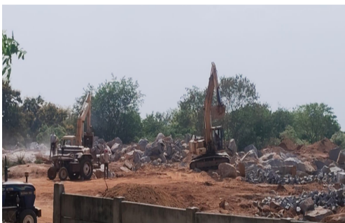
కొందరు పంచాయతీ పార్కు వకన గల 9 ఎకరాల ప్రభుత్వ స్థలాన్ని ఆక్రమించడం పనులు జరుగుతుండడంతో ప్రభుత్వ

- ఎయిర్పోర్ట్ కాలనీ పంచవటి పార్క్ వద్ద ప్రభుత్వ భూమిలో పనులు - అధికారులు స్థలం చుట్టూ ఫెన్సింగ్ ఏర్పాటు చేయాలి