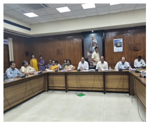
వెనుకబడిన తరగతుల సంక్షేమం కోసం ప్రభుత్వం కృతనిశ్చయంతో ఉంది. కావున ప్రభుత్వం కేటాయిస్తున్న బడ్జెట్

- ఏం.టి.సి కులాల అభివృద్ధి కార్పొరేషన్ పై సమీక్ష సమావేశం నిర్వహించిన ప్రభుత్వ రంగ సంస్థల కమిటీ చైర్మన్